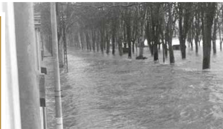
Avenue Henri II sous les eaux.

NOUS SOMMES EN DÉCEMBRE 1947, LE BANSAINSTMARTIN, COMME L'ENSEMBLE DE LA VALLÉE DE LA MOSELLE, EST FRAPPÉ PAR L'UNE DES CRUES LES PLUS IMPRESSIONNANTES DU SIÈCLE. LES ANCIENS EN PARLAIENT COMME « D'UN ÉPISODE OÙ LA RIVIÈRE, D'ORDINAIRE FAMILIÈRE, SE TRANSFORMA EN UNE FORCE INDOMPTABLE ». CERTAINES CAVES ET SOUS-SOL GARDENT ENCORE LES MARQUES DE CETTE ÉPREUVE.