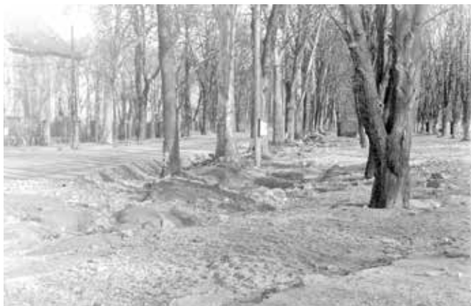
L'état des rues après le passage des eaux. On peut reconnaître la mairie à gauche de la photo.

Comme toutes les communes du bassin, Le Ban-Saint-Martin fut submergé. Les clichés d'époque montrent l'Avenue Henri II (Route de Metz à l'époque) transformée en lac, les marronniers baignant dans une eau brune et agitée. Les habitants, démunis, observaient la montée inexorable de la rivière, impuissants face à cette masse liquide qui envahissait rues, caves et ateliers. Les secours s'organisèrent tant bien que mal. On circulait en barque route de Plappeville. Les commerces furent touchés, les réserves rendues inutilisables. Les restrictions de l'Après-Guerre ainsi que l'hiver, déjà rude, laissèrent les Ban-Saint-Martinois désemparés, face à cette épreuve supplémentaire. La crue de décembre 1947 est encore considérée comme la crue de référence pour le bassin aval de la Moselle, tant par son ampleur que par la soudaineté du phénomène. Elle marqua durablement la mémoire locale et contribua à façonner la conscience du risque dans les communes riveraines.