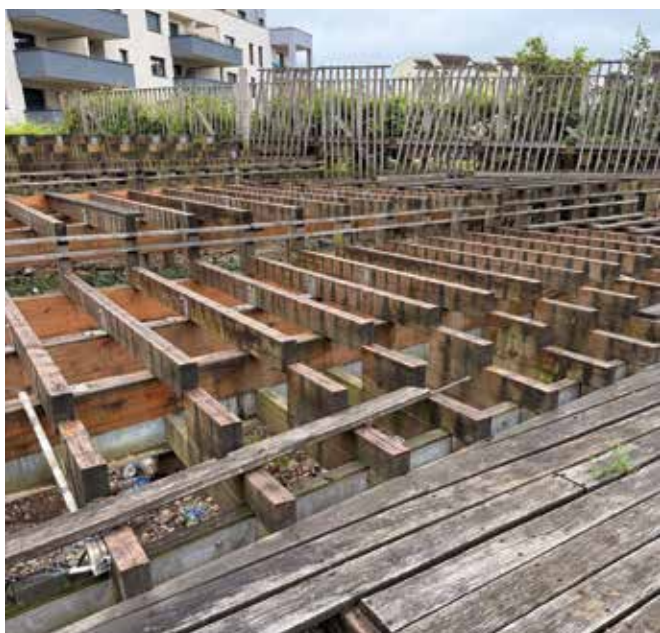
Le démontage de l'estrade est en cours.

D'abord, il y a cette promesse de campagne qui se concrétise. Celle de l'installation des nouvelles caméras, projet qui avait déjà été anticipé par l'ancienne majorité. À l'heure où je vous parle, cela concerne huit remplacements et trois nouvelles installations. En 2027, nous ne nous interdisons pas d'en ajouter mais il faut que ce soit pertinent. Second dossier en cours, celui du démontage de l'estrade de la Hottée de Pommes qui cèdera la place au projet de jardin urbain, autre promesse de campagne. Le mercredi 10 et le samedi 20 juin seront consacrés à des moments de concertation citoyenne. L'équipe de paysagistes qui nous accompagne sur ce dossier, tiendra des stands où chaque habitant exposera sa vision du jardin idéal. Une façon de laisser la place à l'expression citoyenne. Ces mêmes habitants seront également sollicités, s'ils le souhaitent, à venir planter lors du chantier participatif que nous mènerons en novembre. Cette opération mobilise une enveloppe de 80 000 € sur deux ans.