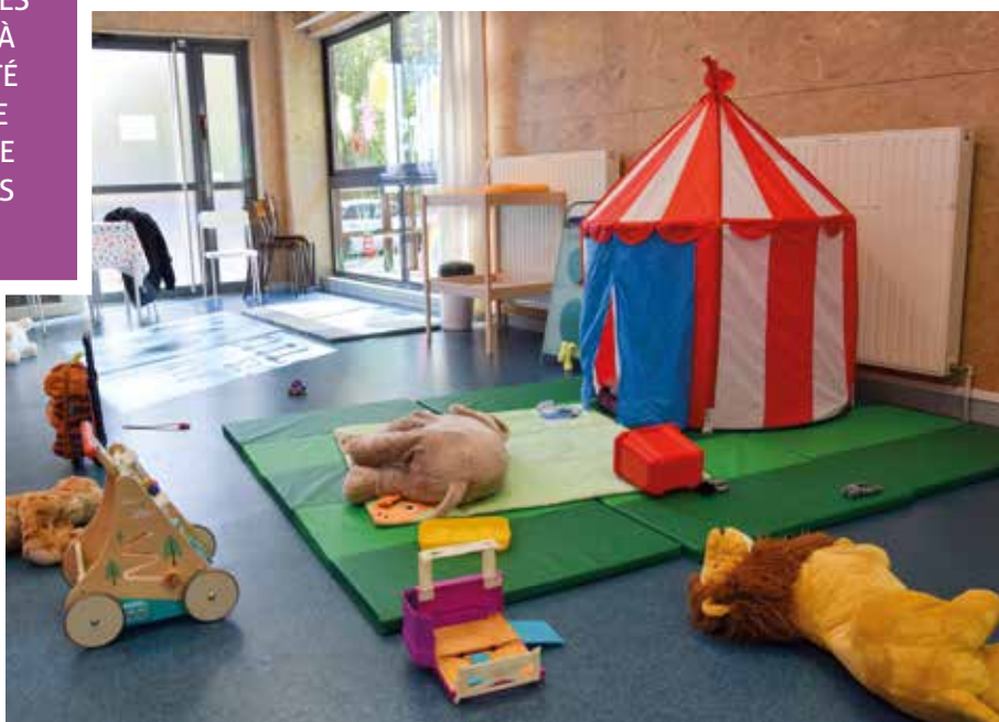
Depuis décembre 2025, la municipalité met à disposition une salle pour les assistantes maternelles au Ru-Ban.